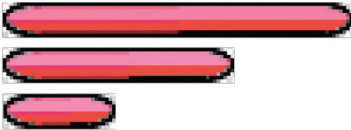
Rysunek 13.7. Platforma w powiększeniu

Tak jak w przypadku obrazów Mr. Stick Mana, zapisz je w folderze stickman . Nazwij największą platformę platform1.gif , średnią platform2.gif i najmniejszą platform3.gif .